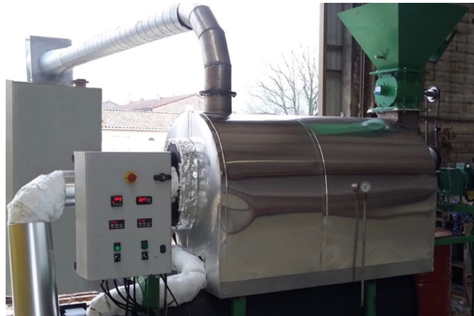
Le CarboChar-1 de Pro-Natura

Les CarboChar-3 et 4 peuvent par ailleurs produire de l'électricité en cogénération : leur fonctionnement en production dégage respectivement 1 MW et 2 MW de chaleur renouvelable qui peut être convertie en électricité grâce à une technologie ORC ( Organic Ranking Cycle ), laquelle transforme l'énergie thermique en énergie mécanique puis en électricité via un générateur électrique.