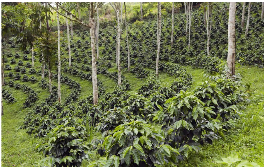
Système agroforestier caféier

Pro-Natura travaille en partenariat avec le Centre international de recherche en agroforesterie (ICRAF), un centre d'excellence en science et en développement basé à Nairobi. Notre objectif est de développer l'« agriculture intelligente face au climat » ( Climate-Smart Agriculture ) à l'échelle de l'Afrique, en séquestrant 600 millions de tonnes de gaz à effet de serre sur les 20 prochaines années tout en multipliant par trois les revenus de 10 millions d'agriculteurs.