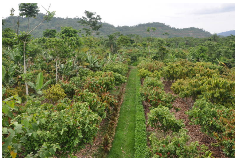
Système agroforestier cacaoyer

Ces savoirs et savoir-faire ont été regroupés au sein de nos deux guides pratiques de formation à l'agroforesterie, disponibles sur le site Internet de Pro-Natura sous l'onglet « Combattre la pauvreté ».