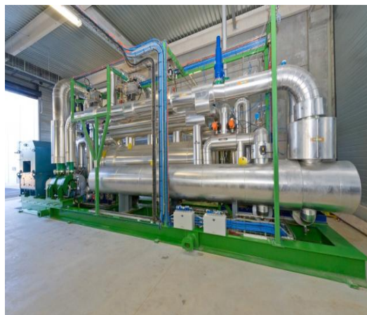
Exemple d'ORC fabriqué par Enertime

Pro-Natura International UK • 29 Downside Crescent, London NW3 2AN